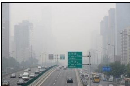
Vue du centre de Pékin prise le 29 juillet 2010.