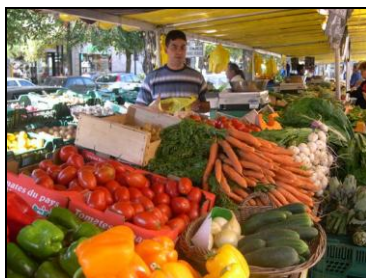
Étalle de fruits et légumes sur un marché local