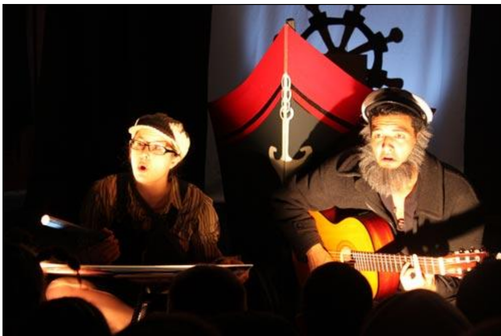
Eliot et la capitaine Fumasse face au continent de déchets